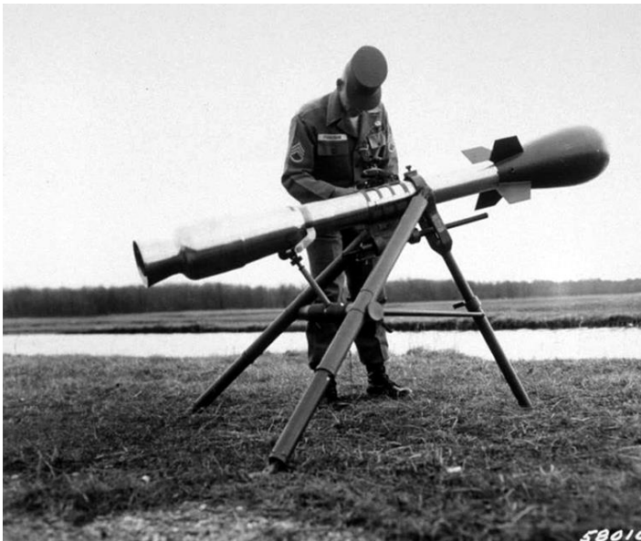
Lance-roquette nucléaire tactique « Davy Crockett » M-388. (US DoD, mars 1961).